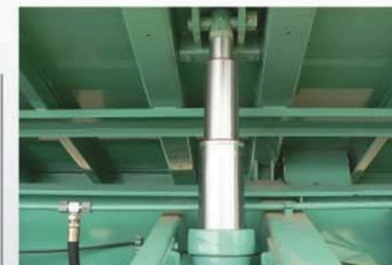
< CILINDRO HIDRÁULICO DESPLEGABLE EN 3 TRAMOS.