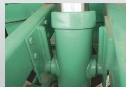
< ANCLAJE CILINDRO HIDRÁULICO.