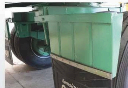
< GUARDAFANGO REBATIBLE.